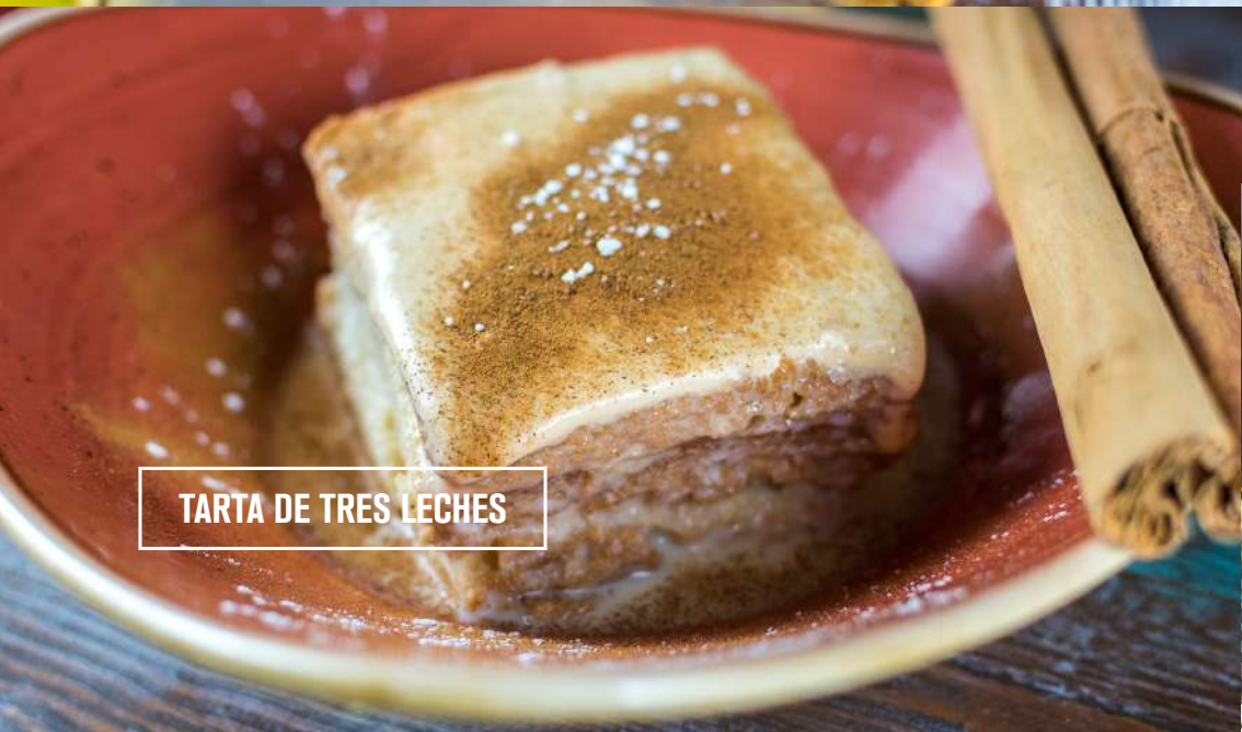
TARTA DE TRES LECHE

TARTA CASERA DE QUESO CREMOSO SOBRE LAMINAS DE MANGO MACERADAS EN LIMA Y CAMELO.