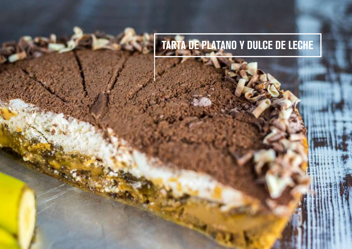
TARTA DE PLATANO Y DULCE DE LECHE