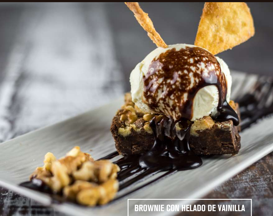
BROWNIE CON HELADO DE VAINILLA